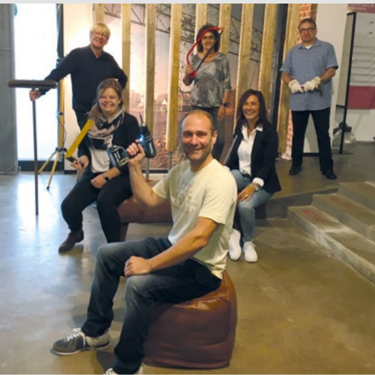
Wir, das Team von Augenoptik Stemmann, freuen uns auf Ihren Besuch – in unseren neuen Verkaufsräumen!